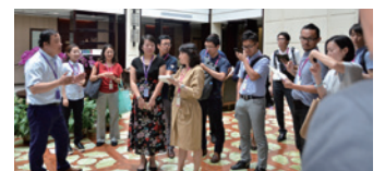
▲海外視察ツアーの様子

春はアジア・秋は欧米の介護・高齢者住宅事情視察ツアーを主催。(11月6日～11日) ロンドン視察ツアー開催